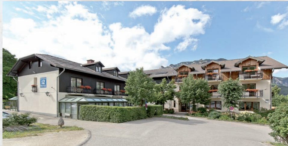
Flackl-Wirt, Hinterleiten 12, 2651 Reichenau an der Rax